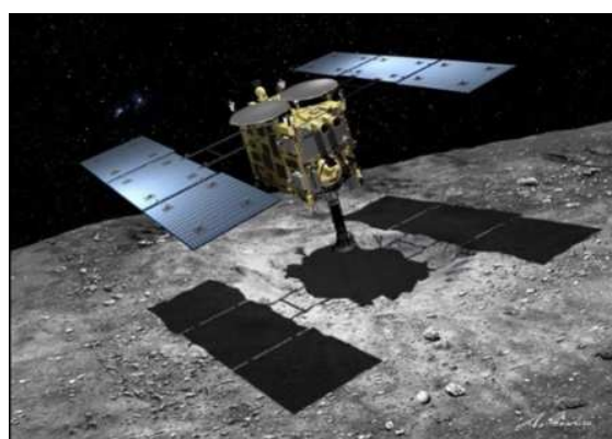
イラスト：池下章裕

「はやぶさ2」には、当社の宇宙用リチウムイオン二次電池が搭載されており、打ち上げ直後、およびカプセルの地球帰還時における日陰運用において、電池より探査機へ電力を供給することでミッションの成功を支えました。